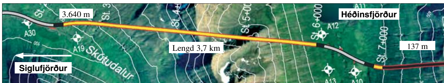
Staða framkvæmda við Héðinsfjarðargöng 26. maí. 2008. Sprengingum frá Siglufirði til Héðinsfjarðar lauk 21. mars 2008.

Gröftur Héðinsfjarðarganga frá Héðinsfirði gekk vel í viku 21. Sprengdir voru 65 m og er heildarlengd ganga þeim megin frá um 137 m. Ólafsfjarðarmegin gekk mun hægar vegna bergþéttinga en þar voru sprengdir um 21 m og er heildarlengd ganga þeim megin frá um 3.175 m. Samtals er því búið að sprengja 6.952 m eða 65,7% af heildarlengd.