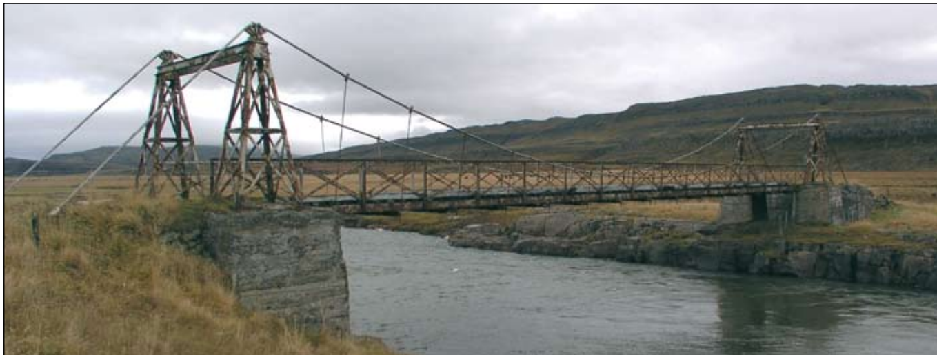
Nýleg mynd af hengibrúnni á Örnólfsdalsá.