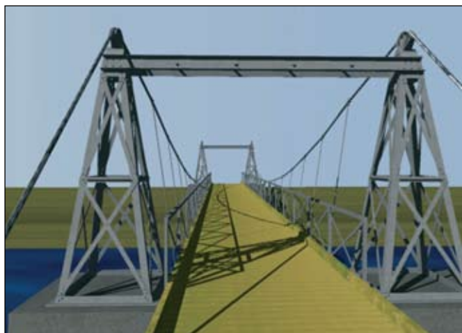
Tölvugerð mynd af hengibrúnni eins og hún mun líta út eftir endurgerð. Mynd: Guðrún Þóra Garðarsdóttir.

Brúin er 33 m löng. Stálið í brúna var smíðað í Kaupmannahöfn.