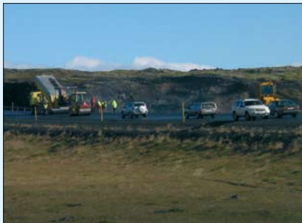
Malbikun á Hellisheiði.