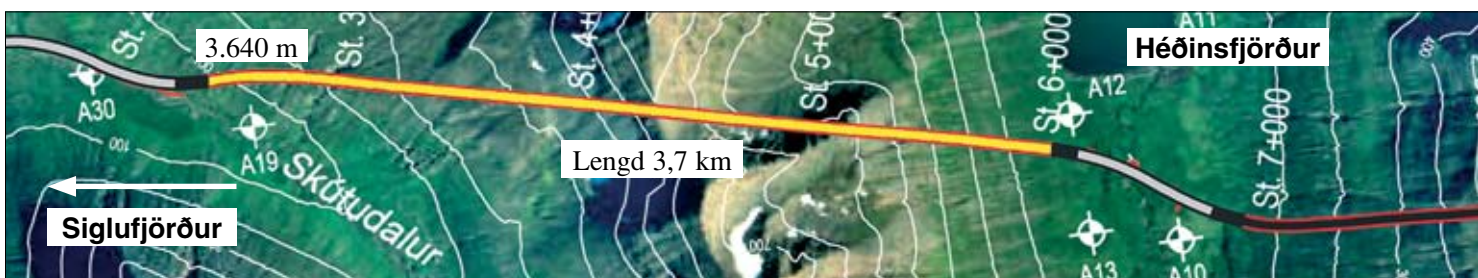
Staða framkvæmda við Héðinsfjarðargöng 24. mars. 2008. Búið er að sprengja 3.640 m í Siglufirði og 2.697 m í Ólafsfirði.

Ólafsfjarðarmegin gekk hægar vegna bergþéttinga og voru sprengdir um 21 m og er lengd ganga þeim megin frá 2.697 m. Samtals er því búið að sprengja 6.337 m eða um 60% af heildarlengd.