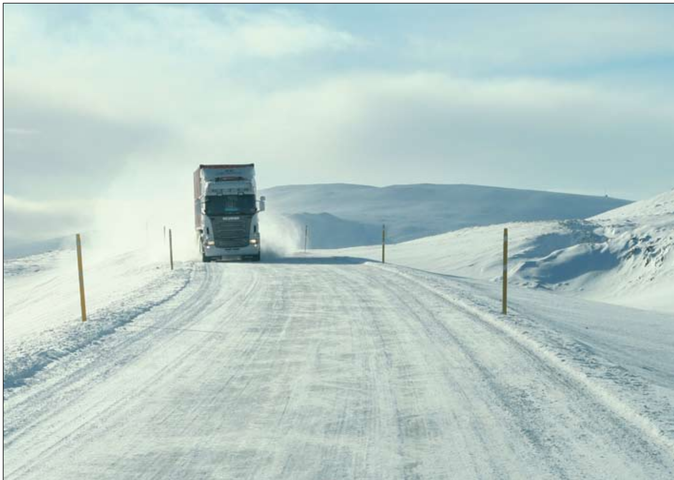
Á Þverárfjallsvegi 28. febrúar 2008.