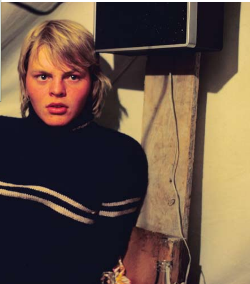
Hallgrímur Helgason rithöfundur heimsótti fund starfsfólks þróunarsviðs Vegagerðarinnar 13. desember sl. Við það tækifæri var honum færð ljósmynd af honum sjálfum sem var tekin þegar hann var ungur maður í brúarvinnu í Ísafjarðardjúpi.