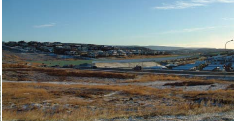
Hljóðmanir við Reykjanesbraut.