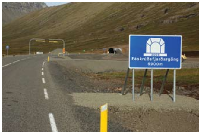
Gangamunni í Fáskrúðsfirði.