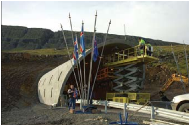
Á vígsludegi var enn unnið að frágangi við Fáskrúðsfjarðargöng og einhver vinna heldur áfram næstu vikur.