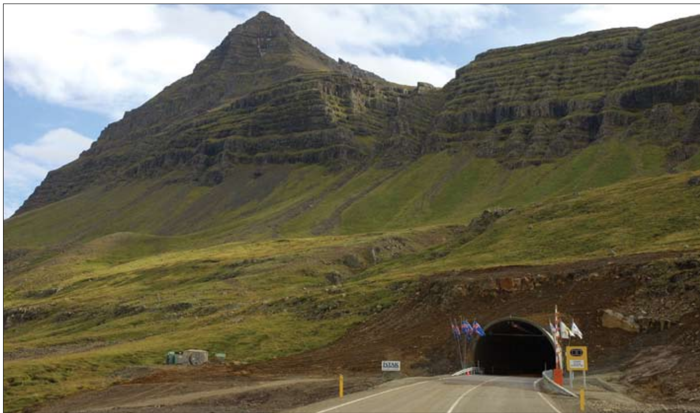
Fáskrúðsfjarðargöng á vígsludegi 9. september 2005. Kambfell heitir fjallið fyrir ofan gangamunnann í Reyðarfirði.