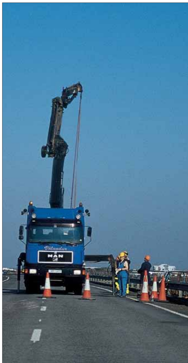
Viðhaldsvinna á Borgarfjarðarbrú.