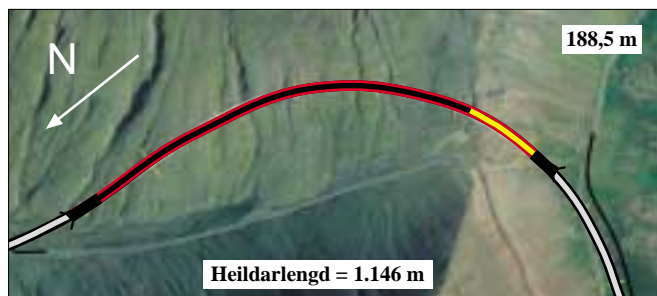
Staða framkvæmda við Almannaskarðsgöng 5. júlí 2004. Samtals er búið að sprengja 188,5 m sem gerir 16,4%.

Skila skal tilboðum á sömu stöðum fyrir kl. 14:00 þriðjudaginn 27. júlí 2004 og verða þau opnuð þar kl. 14:15 þann dag.