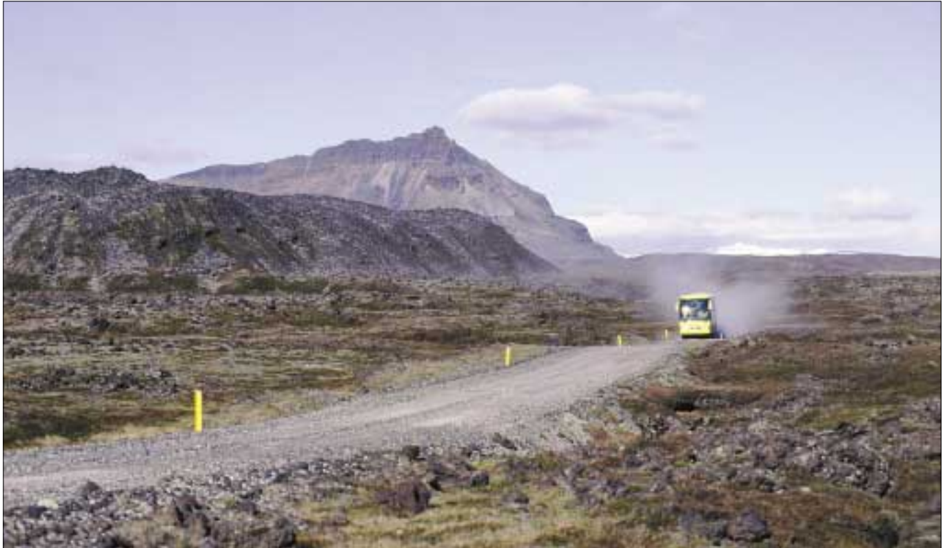
Útnesvegur (574) á Snæfellsnesi. Við mörk þjóðgarðs undir jökli.