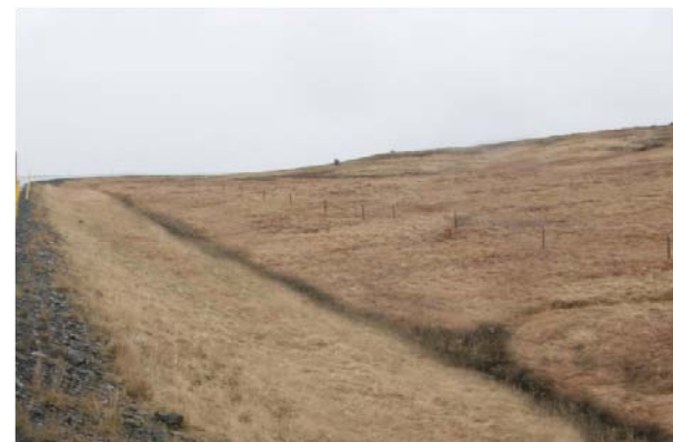
Mynd 5 og 6 Fyrir og eftir að skurður hefur verið lagaður