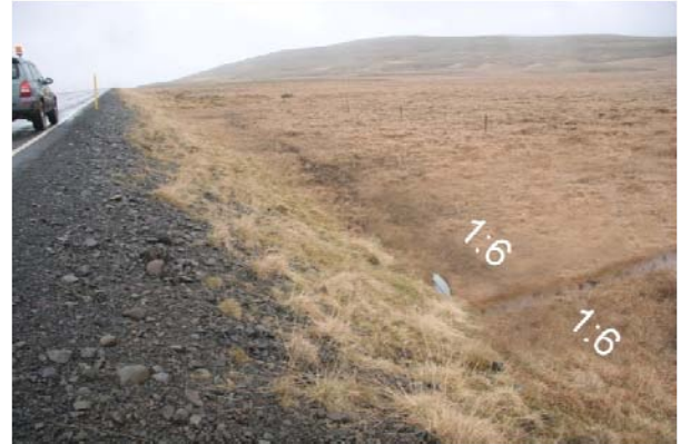
Mynd 7 og 8 Fyrir og eftir að skurðflái við ræsaenda hefur verið lagaður

Eins og sést á mynd 10 hefur grjót verið fjarlæggt. Þarna er skurður meðfram vegi fyrir utan öryggissvæðin og er því ekki nauðsynlegt að lagfæra hann.