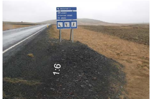
Mynd 13 og 14 Fyrir og eftir að flái við skiltapúða hefur verið lagaður

Fjarlægja skal grjót sem hefur hrunið í skeringum, slíkt þarf að gera eftir aðstæðum nokkrum sinnum á ári. Sjá myndir 15 og 16.