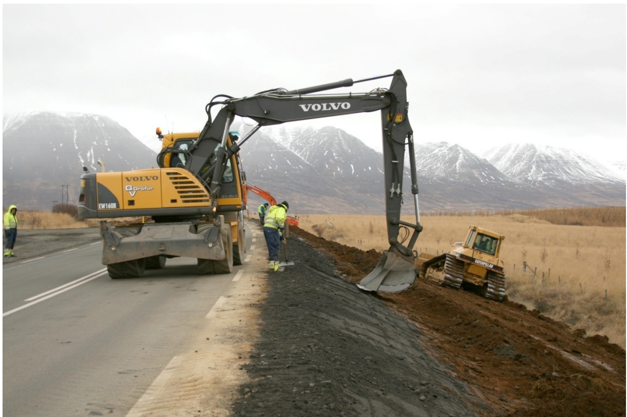
Mynd 17 Hringvegur á Moldhaugahálsi norðan Akureyrar, þarna er verið að keyra utan á fláa til að draga úr bratta

Mynd 17 sýnir menn lagfæra vegfláa í þeim tilgangi að bæta umferðaröryggi.