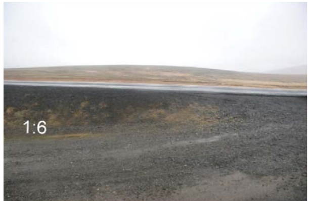
Mynd 11 og 12 Fyrir og eftir að flái við vegamót hefur verið lagaður og grjót fjarlæggt