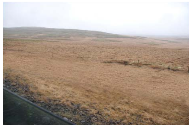
Mynd 3 og 4 Fyrir og eftir grjóthreinsun og jöfnun

Djúpir skurðir meðfram vegum eru mjög hættulegir vegfarendum. Þar sem ræktun er aflögð er eðlilegast að fylla upp í þessa skurði með því að fletja bakka þeirra ofan í þá. Flái bakkans vegarmegin skal vera í samræmi við mynd 1, en fláinn fjær veginum skal ekki vera brattari en 1:2. Einungis er gert ráð fyrir vatnsrás vegna yfirborðsvatns. Á myndum 5 og 6 er sýnt dæmi um hvernig land lítur út fyrir og eftir fyllingu skurðar.