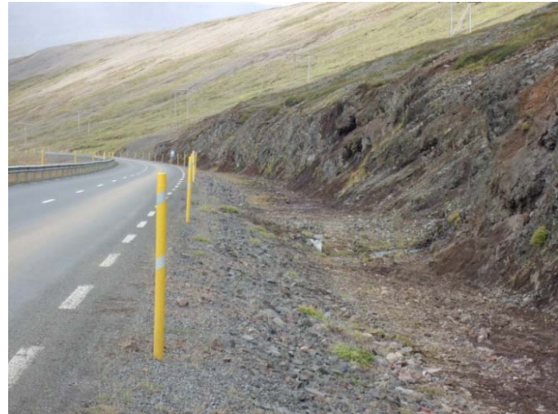
Mynd 15 og 16 Fyrir og eftir að grjót sem hefur hrunið í skeringu hefur verið fjarlæggt

Tré og tréstólpar sem eru sverari en 0,1 m í þvermál í 0,4 m hæð frá jörðu skulu fjarlægðir og þeim komið fyrir á viðurkenndum urðunarstað eða efnið sett í geymslu til síðari nota. Gæta skal þess að fylla í holuna sem myndast við að fjarlægja tréd/tréstólpann og ganga snyrtilega frá yfirborðinu eins og áður hefur verið lýst.