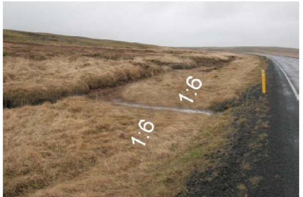
Mynd 9 og 10 Fyrir og eftir að skurðflái við ræsaenda hefur verið lagaður og grjót fjarlæggt

Við vegamót er fyllingarflái þvervegjar oft alltof brattur en hann skal ekki vera brattari en 1:6 innan öryggissvæðisins samkvæmt Veghönnunarreglunum. Þetta getur einnig átt við á öðrum stöðum. Sjá myndir 11 og 12.