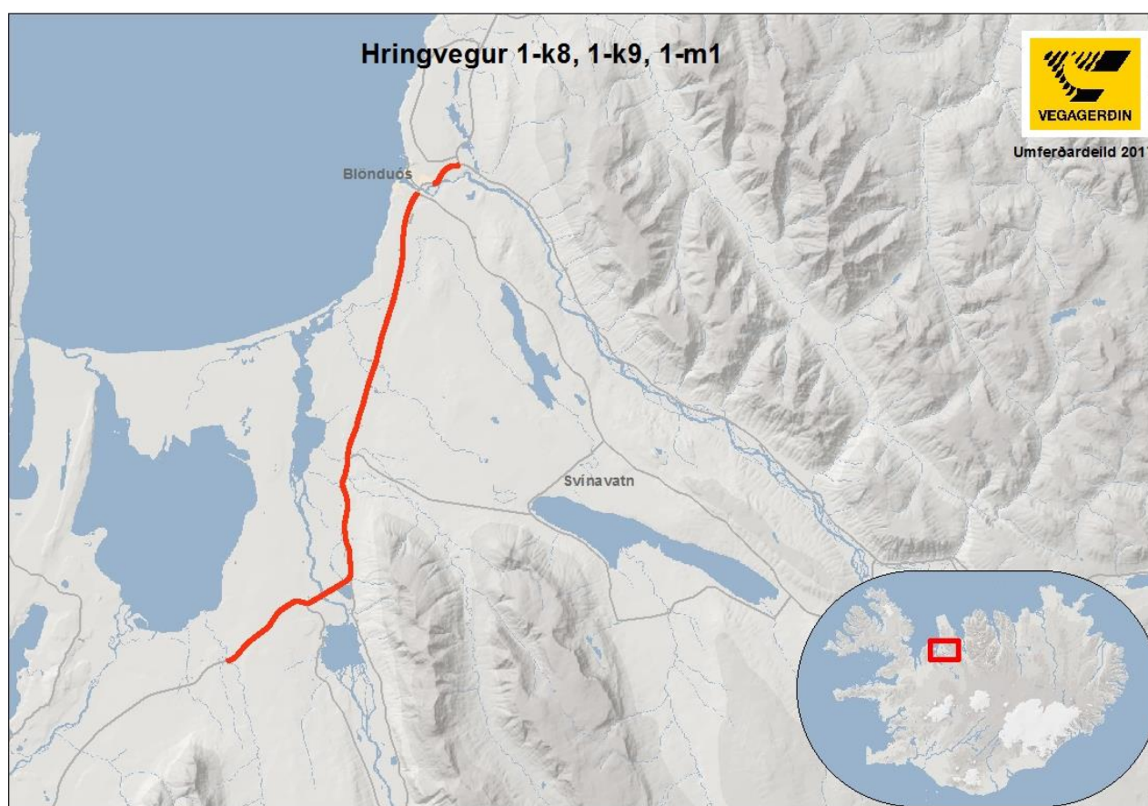
Mynd 1 Hringvegur, 1-k8, 1-k9, 1-m1.

Hringvegur, kaflar 1-k8, er 11,41 km langur, kaflar 1-k9 er 11,40 km langur og kaflar 1-m1 er 1,45 km langur. Þeir voru allir skoðaðir í heild sinni í þessari úttekt. Þessir kaflar tilheyra Norðursvæði Vegagerðarinnar. Kaflar 1-k8 liggur frá Gljúfurá norðaustur að Reykjabraut (724-01), kaflar 1-k9 liggur frá Reykjabraut (724-01) norður að Svínvetningabraut (731-01) og kaflar 1-m1 liggur frá Blönduósi, Efstubraut norðaustur að Skagastrandarvegi (74-01). Hringvegur er stofnvegur. Ársdagsumferð, ÁDU, árið 2013, á þessum vegköflum var 1177-1334 bílar á sólarhring. Leyfilegur hámarkshraði er 90 km/klst. á vegköflunum fyrir utan í lok kafla 1-k9 og byrjun kafla 1-m1, við Blönduós, þar er leyfilegur hámarkshraði 50 km/klst., sjá nánar töflu 1. Kaflar 1-m0 liggur í gegnum þéttbýlið á Blönduósi og var hann ekki tekinn út í þessu verkefni.