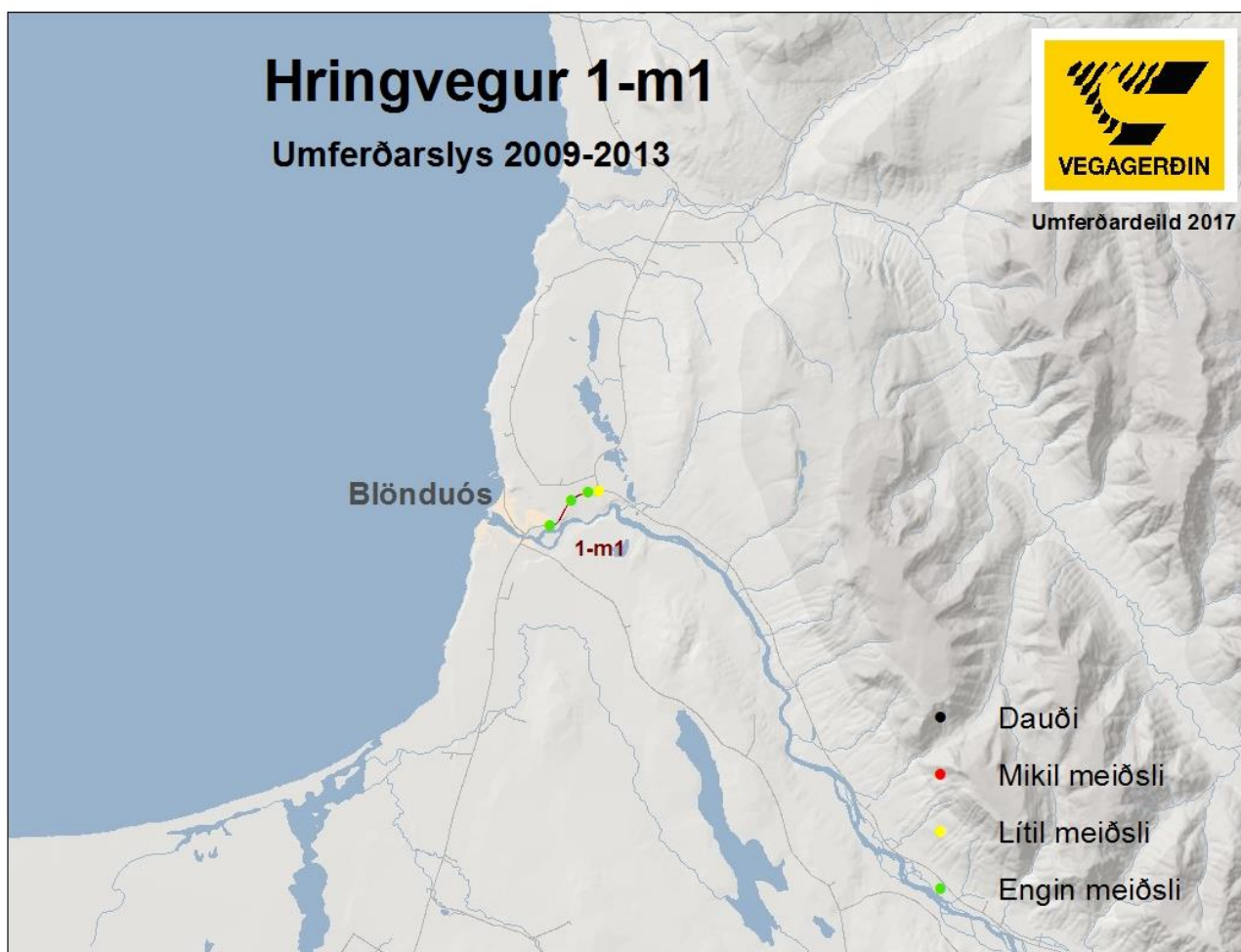
Mynd 3 Umferðarslys á Hringvegi, 1-m1.

Á vegkafla 1-m1 urðu sjö slys á tímabilinu 2009-2013. Í tveimur slysum urðu lítil meiðsli á fólki, bæði urðu þegar ekið var þvert yfir veg og útaf við sömu T-vegamótin. Í öðru slysinu var dagsbirta úti og færðin skilgreind sem góð. Í hinu slysinu var rökkur úti og blautt.