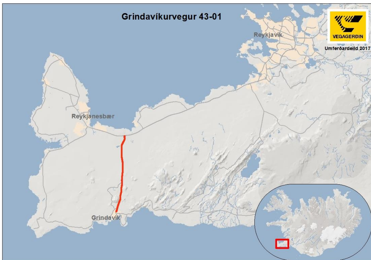
Mynd 1: Grindavíkurvegur, 43-01.

Grindavíkurvegur kafli 43-01 er 13,30 km langur. Kaflinn var skoðaður í tvennu lagi í þessari úttekt. Kaflinn tilheyrir Suðursvæði Vegagerðarinnar. Kafli 43-01 liggur frá Reykjanesbraut (41-16/41-17) að Grindavík, Gerðavöllum. Grindavíkurvegur er stofnvegur með bundnu slitlagi. Ársdagsumferð, ÁDU, árið 2016, var 4240 bílar á sólarhring á þeim hluta vegkaflans sem liggur milli Reykjanesbrautar og Bláalónsvegar en 2880 bílar á sólarhring milli Bláalónsvegar og Gerðavalla. Vegin meðalumferð, ÁDU, á öllum kaflanum árið 2016 var 3710 bílar á sólarhring sjá töflu 1. Leyfilegur hámarkshraði á Grindavíkurvegi, þ.e. á kafla 43-01, er að mestu 90 km/klst. Í upphafi og lok kaflans er leyfilegur hámarkshraði lægri, frá stöð 0-245 og frá stöð 12970-13300 er hann 50 km/klst. og frá stöð 12300-12970 er leyfilegur hámarkshraði 70 km/klst.