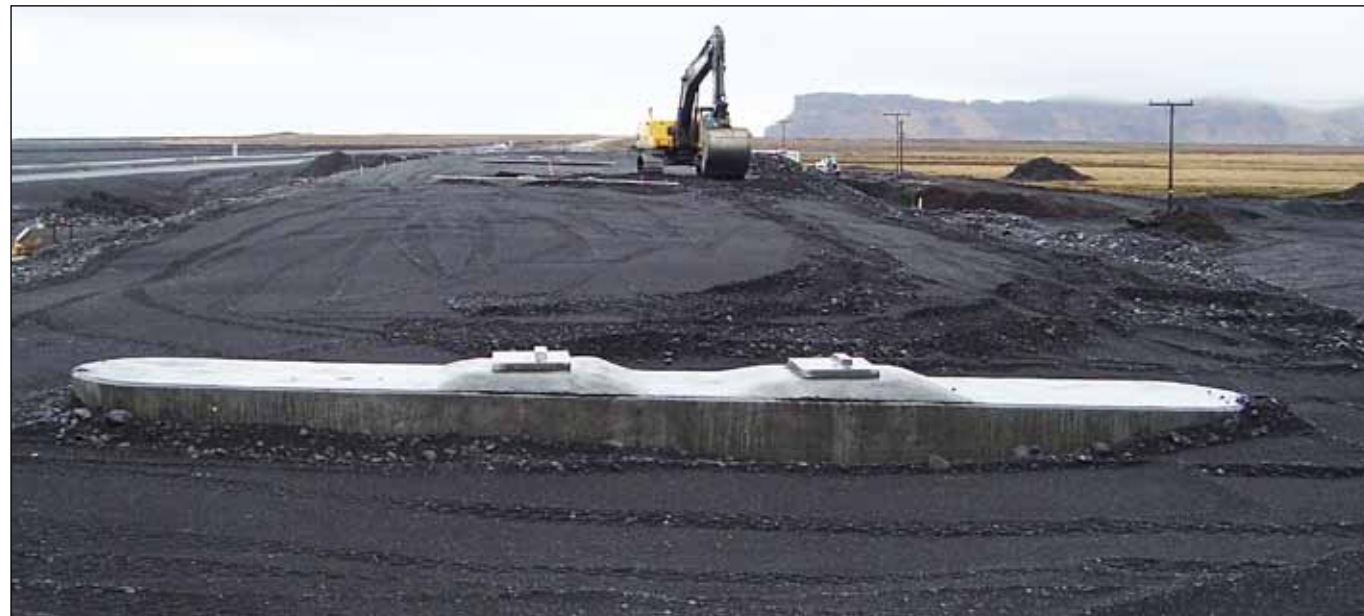
Stöplar nýrrar brúar yfir Múlakvísl bíða þess að hafist verði handa við gerð yfirbyggingar. Að verki loknu verður fyllingarefnið fjarlægt undan brúnni. Hjörleifshöfði í baksýn.

Engir samningar hafa verið undirritaðir frá því síðasta tölublað kom út