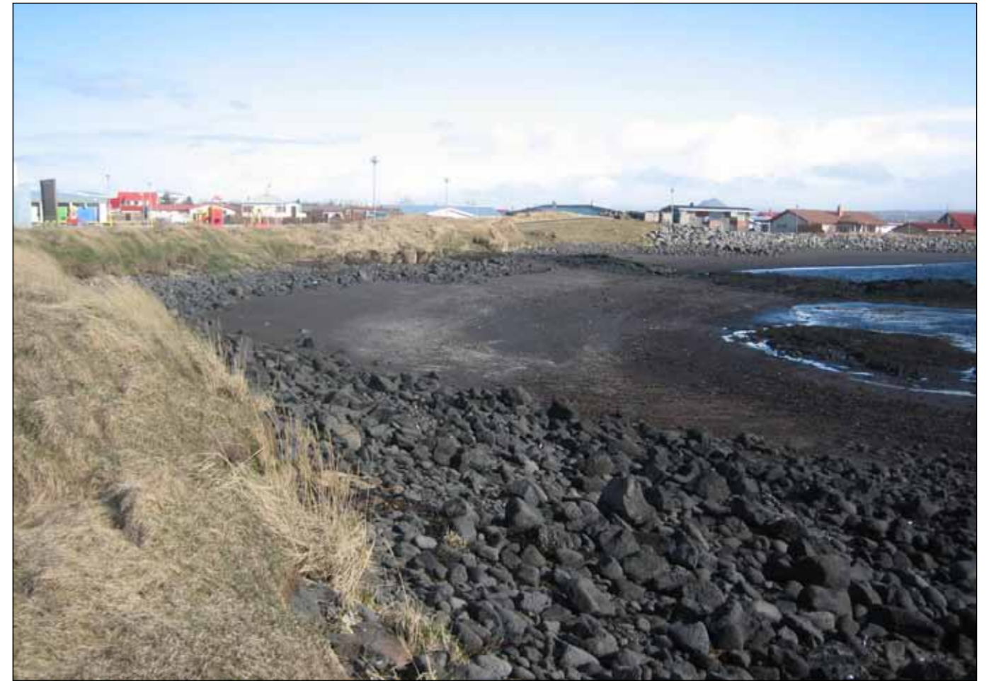
Vogar. Einn af þremur stöðum á Vatnsleysuströnd þar sem gera skal sjóvarnargarð skv. útboðsauglýsingu.