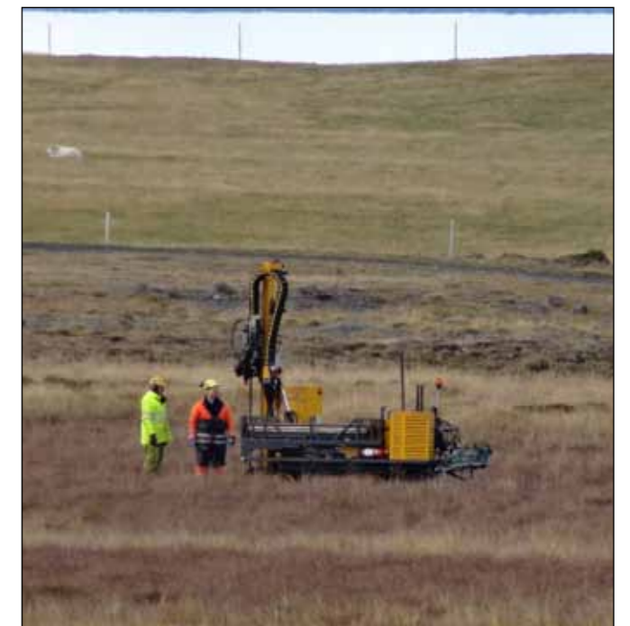
Vegarstæði fyrir tengingu Bakka við Húsavík rannsakað með jarðvegsbor Vegagerðarinnar.

Yfirstjórn Vegagerðarinnar hefur ákveðið að enskt heiti stofnunarinnar skuli vera Icelandic Road and Coastal Administration skammstafað IRCA .